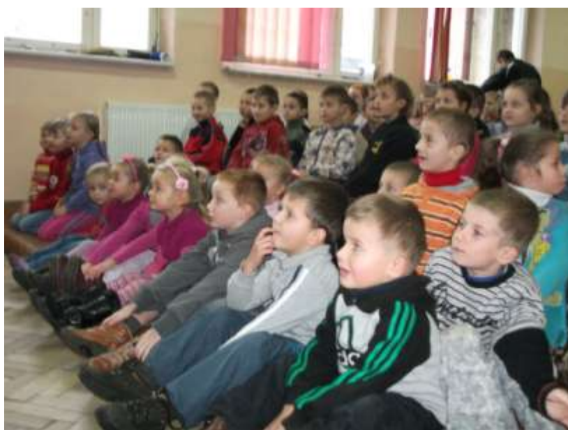
Przedszkolaki oglądający przedstawienie