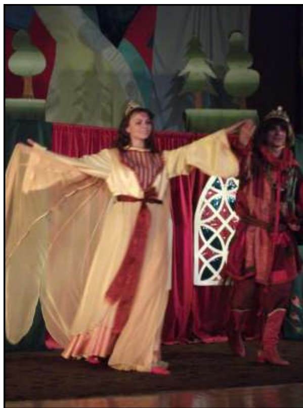
Aktorzy na scenie