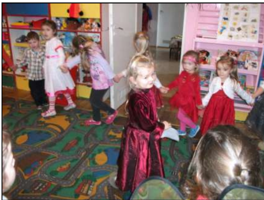
Zabawa w chusteczkę haftowaną