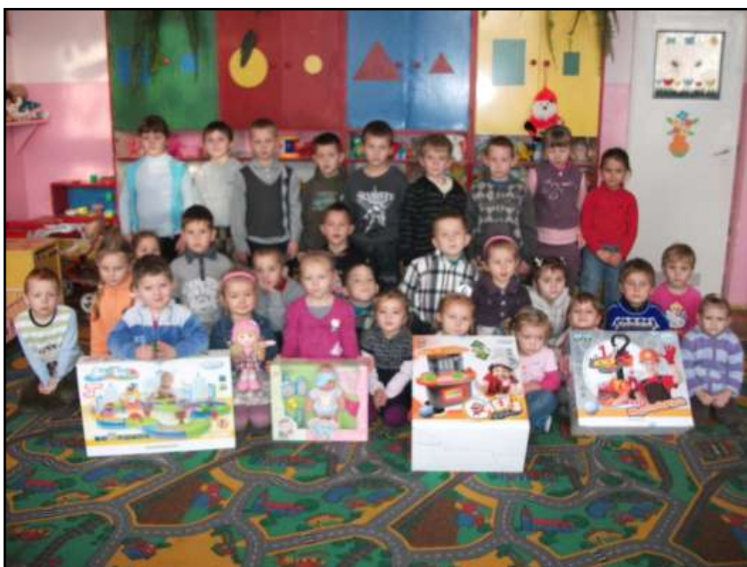
Dzieci z zabawkami od nieznanego darczyńcy

4 grudnia do przedszkola przywieziono zabawki, które zostały zakupione z pieniędzy zbieranych przez rodziców. Radość dzieci była ogromna i zabawa na całego. W późniejszym czasie okazało się, że do przedszkola dostarczono, też zabawki od nieznanego darczyńcy. Święty Mikołaju - dziękujemy.