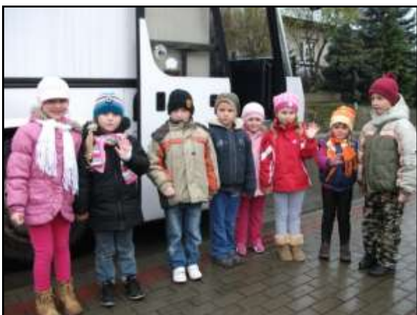
Przedkolaki przy autobusie

5 listopada 2012r. grupa 5-cio latków naszego przedszkola obejrzała bajkę muzyczną „Zło tańcem zwyciężaj”. Sztuka wystawiona została w Centrum Kultury i Czytelnictwa w Brzostku, a jej wykonawcą był Teatr Rozmaitości z Gdańska. Wszystkim przedszkolakom bardzo podobało się przedstawienie, a w szczególności postać Marysi, która za swe dobre serce otrzymała dar uzdrawiania tańcem.