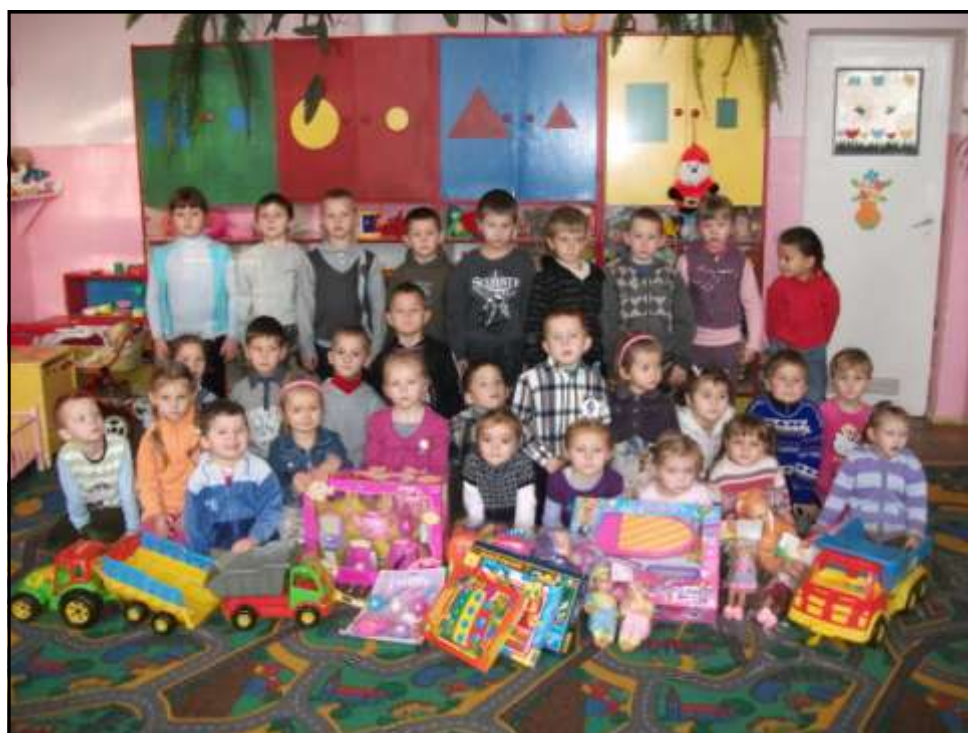
Przedszkolaki z zabawkami od rodziców

4 grudnia do przedszkola przywieziono zabawki, które zostały zakupione z pieniędzy zbieranych przez rodziców. Radość dzieci była ogromna i zabawa na całego. W późniejszym czasie okazało się, że do przedszkola dostarczono, też zabawki od nieznanego darczyńcy. Święty Mikołaju - dziękujemy.