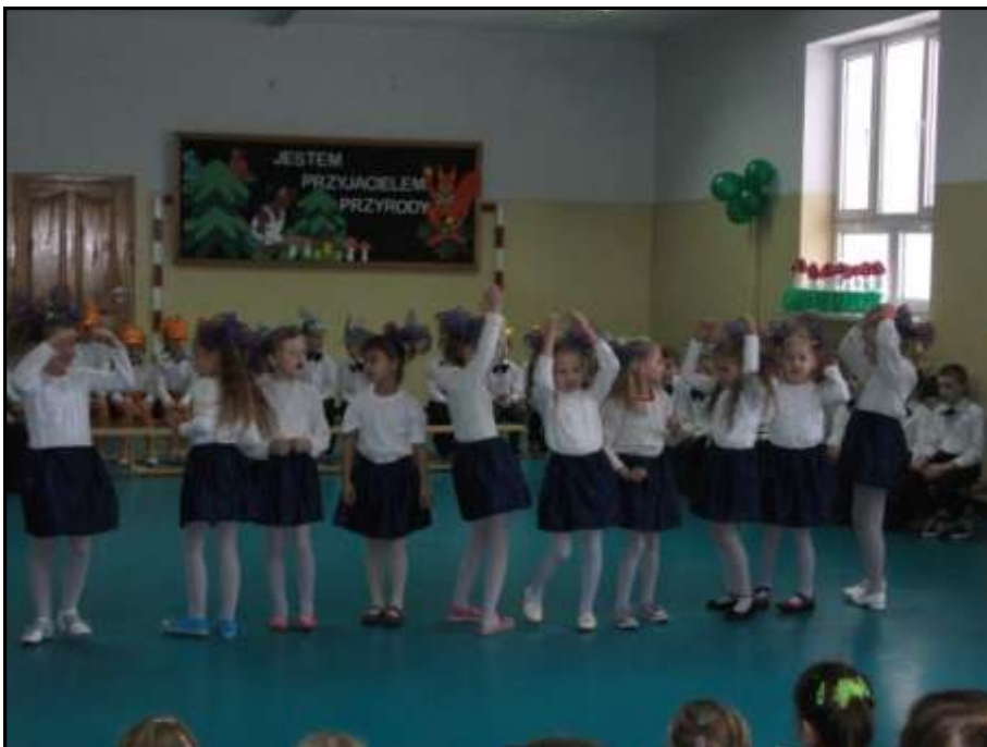
Dzieci na przedstawieniu