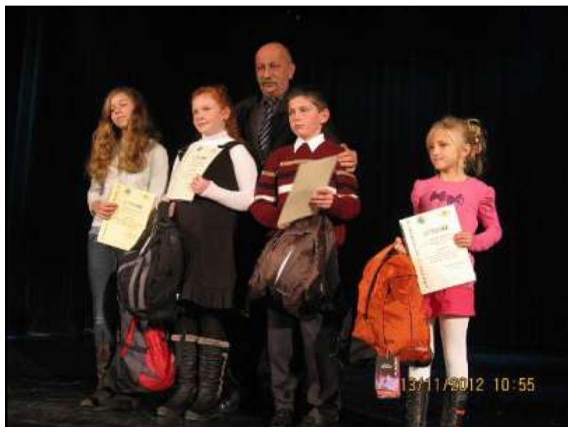
Rozdanie nagród i gratulacje od burmistrza Brzostku