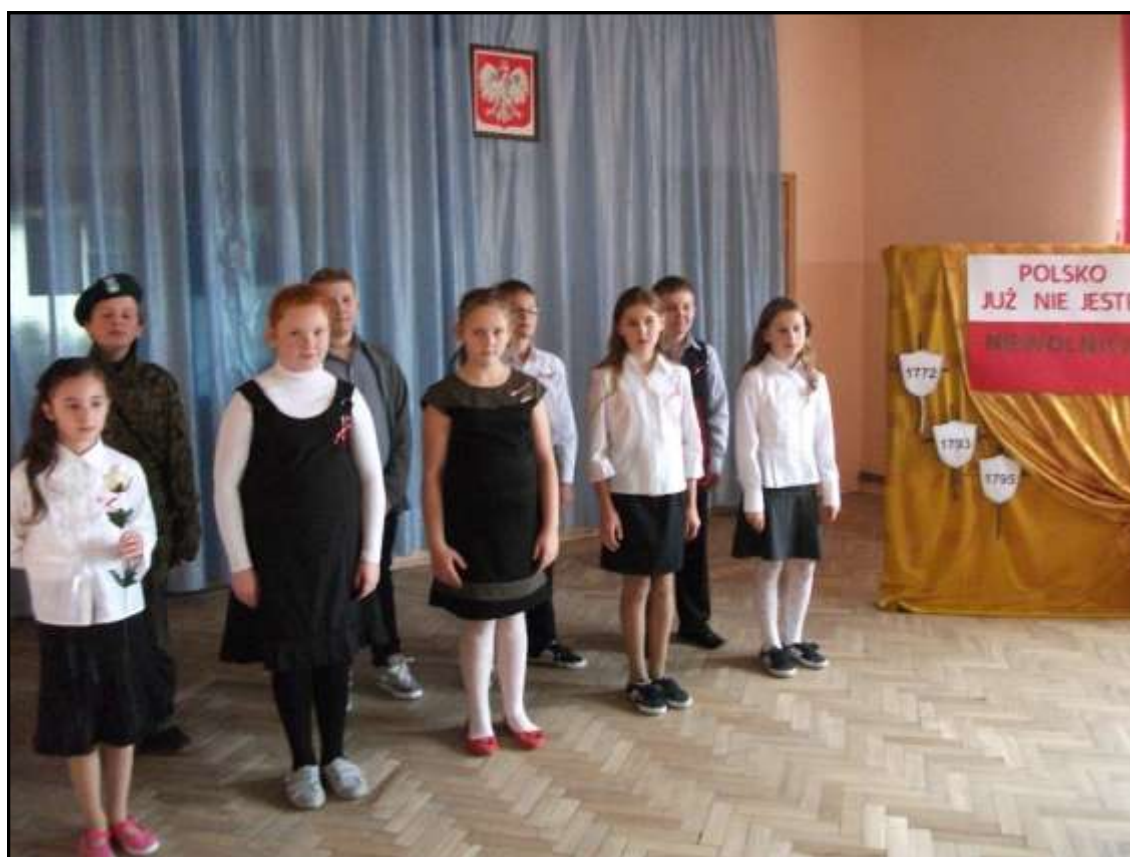
Akademia z okazji Święta Niepodległości

11 listopada to święto narodowe obchodzone w całym kraju. U nas w szkole to święto było obchodzone 8 listopada. Z tej okazji uczniowie naszej szkoły przygotowali inscenizację o tematyce historycznej. Śpiewali piosenki i mówili wiersze, przedstawienie wszystkim się podobało ponieważ inscenizacja wyszła świetnie nikt się nie pomylił, ani nie zapomniał wierszyka. Na końcu pani dyrektor przepytwała uczniów by sprawdzić, czy uważali na przedstawieniu.