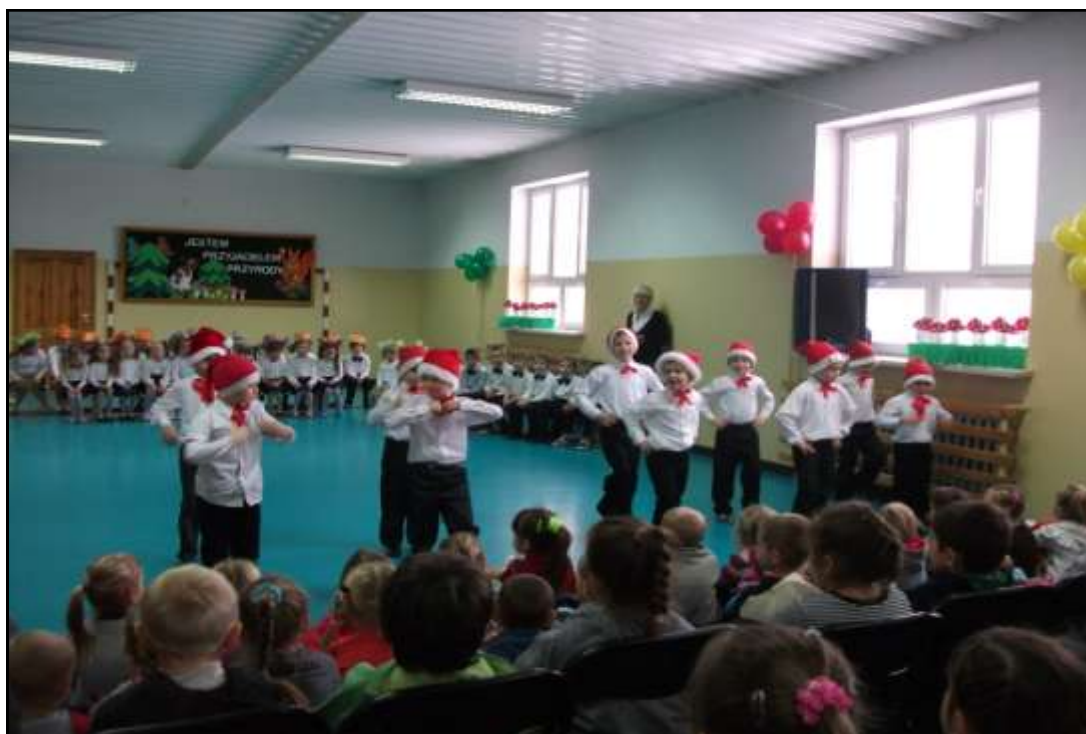
Dzieci ze szkoły w Brzostku na przedstawieniu