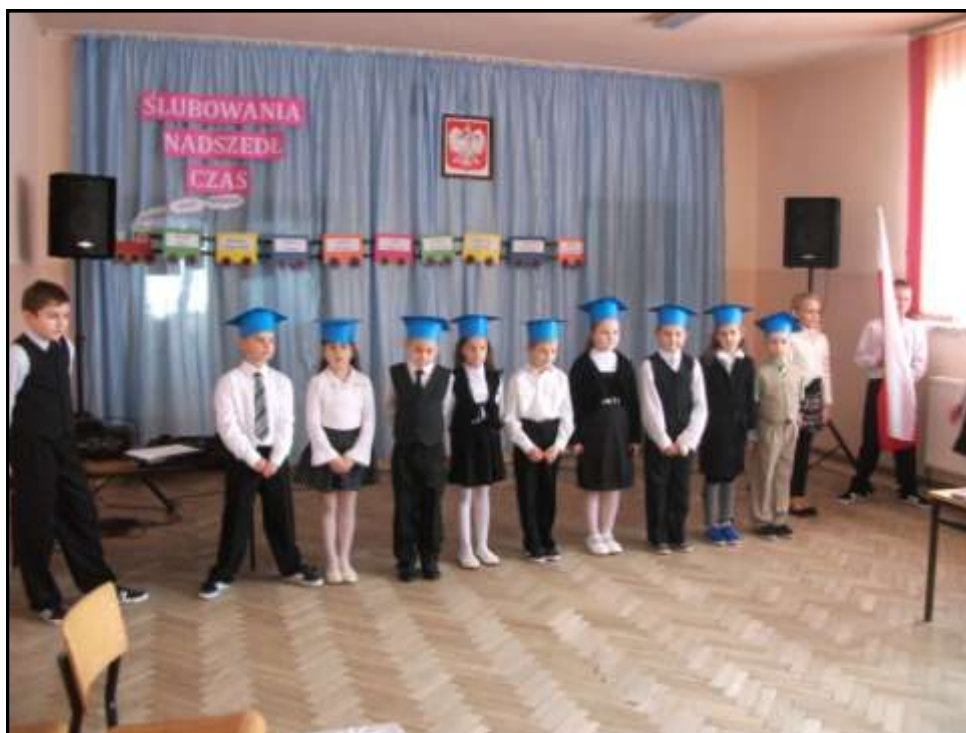
Pierwszaki podczas akademii z okazji pasowanie

4 grudnia 2012 roku odbyło się pasowanie na ucznia. Podczas akademii nasi młodzi koledzy i koleżanki pięknie recytowali, śpiewali. Pierwszaki udowodniły nam, że wiedzą, jak zachować się w szkole. Najmłodszy uczniowie naszej szkoły dostali dyplomy. Po skończonej akademii wraz ze starszymi kolegami pierwszaczki bawili się na dyskotecce. Nasze pierwszaki bardzo się denerwowały, ale wszystko wyszło idealnie. Teraz już są prawdziwymi uczniami. Bardzo serdecznie gratulujemy im zdania egzaminu śpiewająco.