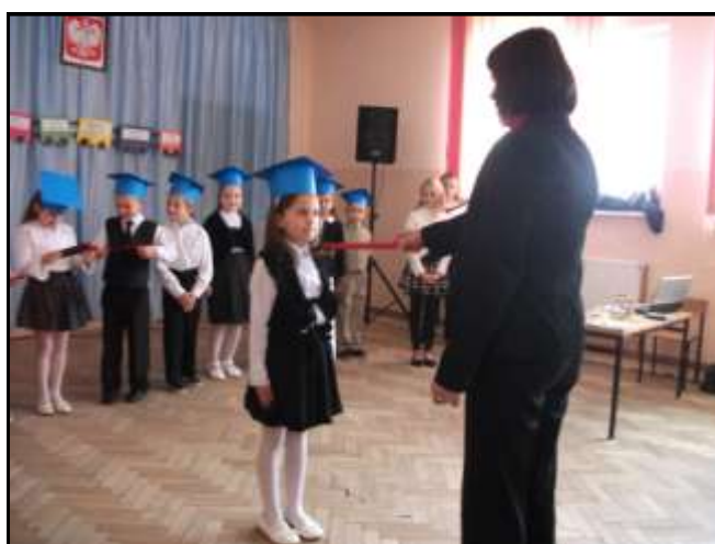
Pasowanie przez panią dyrektor