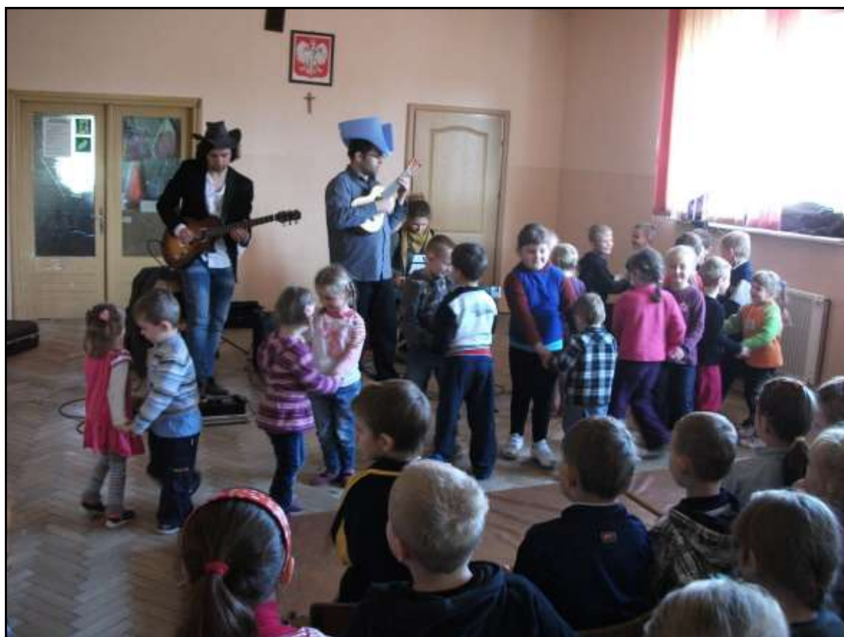
Przedшкоlaki podczas lekcji muzycznej