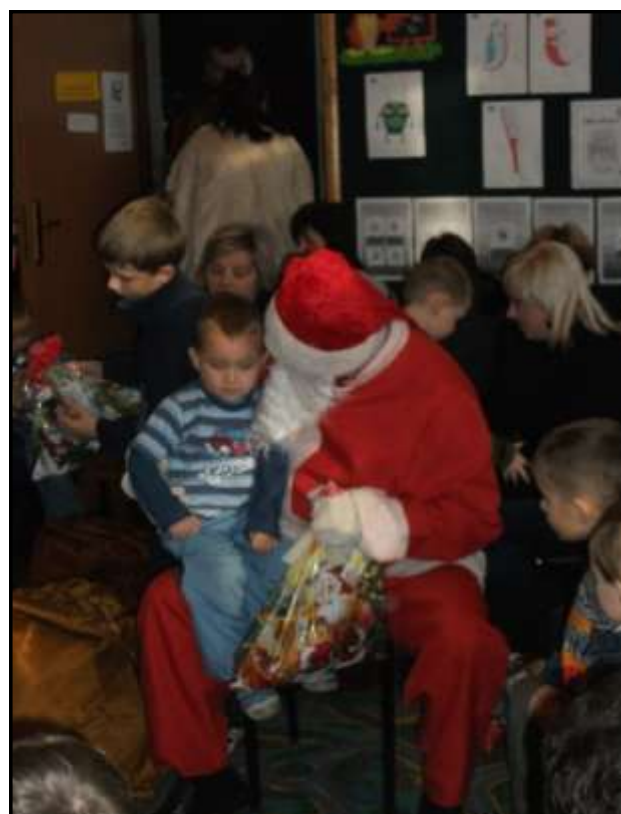
Mikołaj rozdaje prezenty