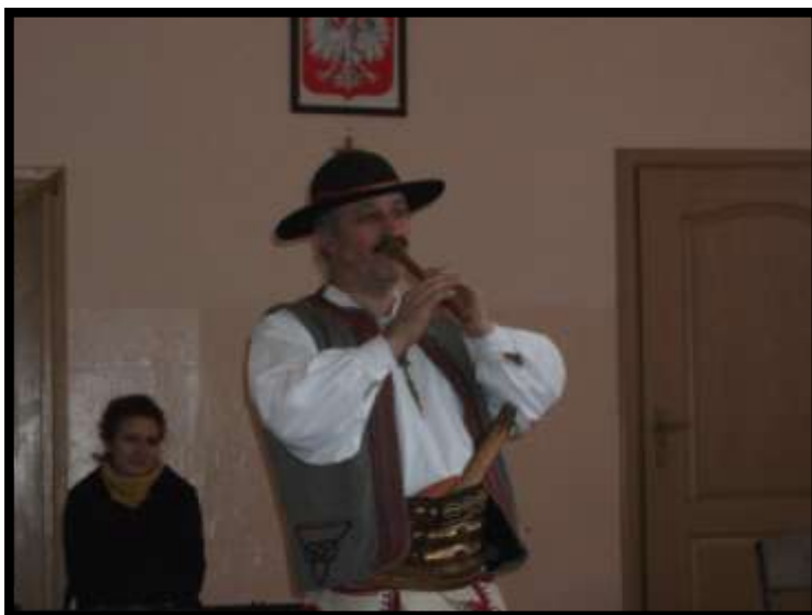
Góral grający na flecie

5 kwietnia w naszej szkole odbyła się długo oczekiwana przez wszystkich lekcja muzyczna pt. „Hej górol, jo se górol”. Każdy nie mógł się go doczekać, ponieważ miał w nim wystąpić prawdziwy góral. Kiedy już wszyscy zajęli swoje miejsca pan prowadzący zaczął opowiadać nam o muzyce ludowej, a później pokazywał nam różne instrumenty. Wszystkim najbardziej spodobał się instrument zwany trąbitą, który służył do komunikowania się z odległości nawet 4 km. Następnie góral razem z grupką chłopców zatańczył góralski taniec, a później taniec wymagający dużej kondycji. Wszystkim bardzo podobało się to przedstawienie. Z niecierpliwością czekamy na następne.