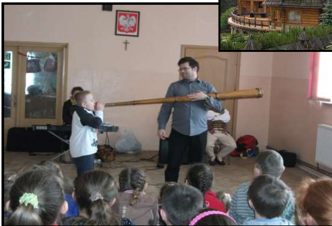
Uczeń grający na trąbitcie