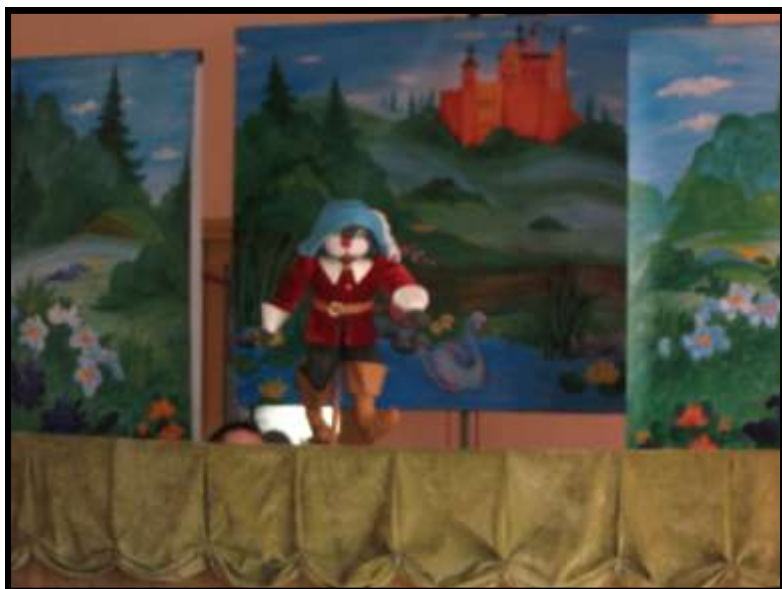
Kukielka „Kot w Butach”

8 kwietnia 2013r do naszej szkoły przyjechał teatrzyk kukielkowy „Bajka” ze Starego Sącza. Teatrzyk wystawił przedstawienie pt. „Kot w butach”, które oglądali przedszkolaki i klasy I, II, III. Kukielki, scenografia i oprawa muzyczna były bardzo interesujące. Rymowane i śmieszne dialogi. Bajka była o trzech braciach, którzy dostali ma-