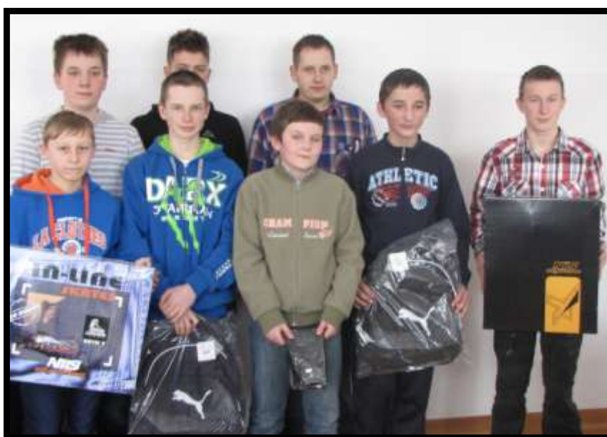
Wszyscy uczestnicy konkursu