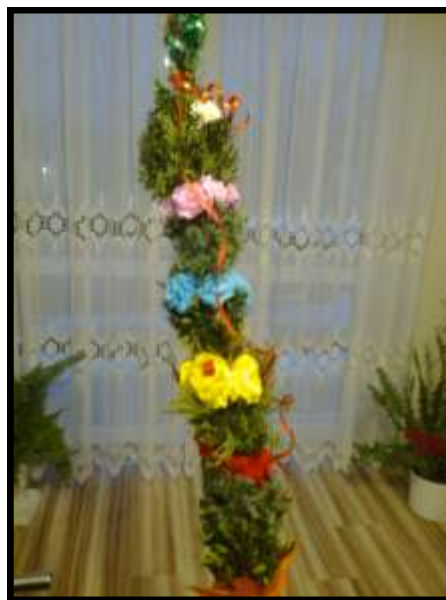
Jedna ze sprzedanych palm

na kolejne tak niezbędne remonty naszej szkoły.