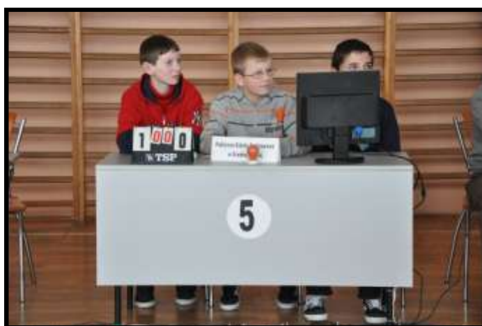
Nasi uczniowie podczas turnieju wiedzy