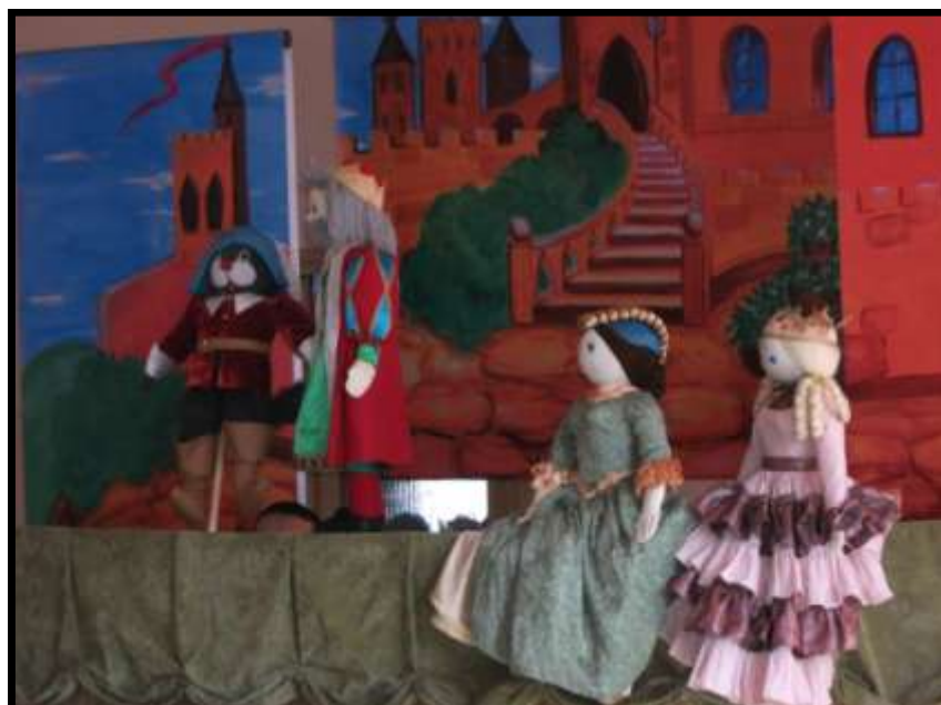
Kukielki rodziny królewskiej

jątek. Najmłodszy z braci Janek dostał kota. Myślał, że ten kot jest zwykły, ale okazało się że, on umiał mówić. Janek ubrał kota w kapelusz i buty. Kot dla swojego właściciela zdobył zamek od czarodzieja i żonę, która była księżniczką. Przedstawienie było bardzo pouczające i wszyscy oglądali z dużym zaciekawieniem. Myślę, że wszystkim dzieciom podobała się ta bajka i nie możemy się doczekać następnego przedstawienia.