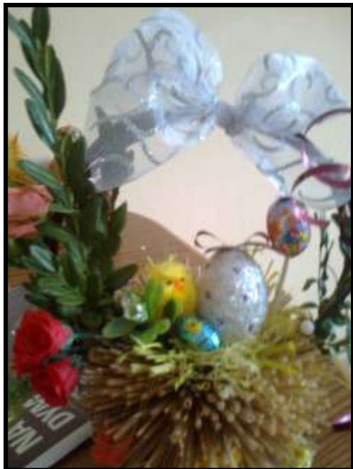
Jeden ze sprzedanych stroików

W niedzielę 17 i 24 marca 2013r. Rada Rodziców działająca przy Publicznej Szkole Podstawowej w Grudnej Górnej zorganizowała kiermasz palm i stroików wielkanocnych, wykonanych przez rodziców i uczniów naszej szkoły. Ozdoby te można było nabyć przy Kościele nawet za przysłowiową złotówkę wspierając w ten sposób budżet remontowy naszej szkoły. Pomysł okazał się strzałem w dziesiątkę, dowodem czego jest kwota, która z pewnością pozwoli