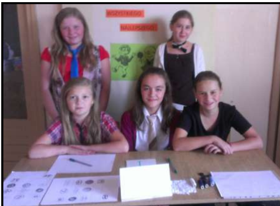
Komisja i prowadzące teleturniej