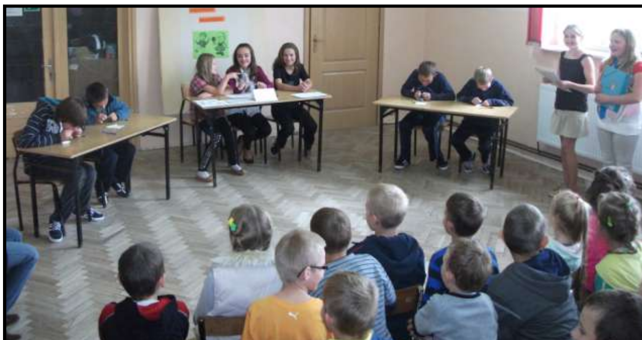
Konkurencja w nawlekanii nitki na igłę