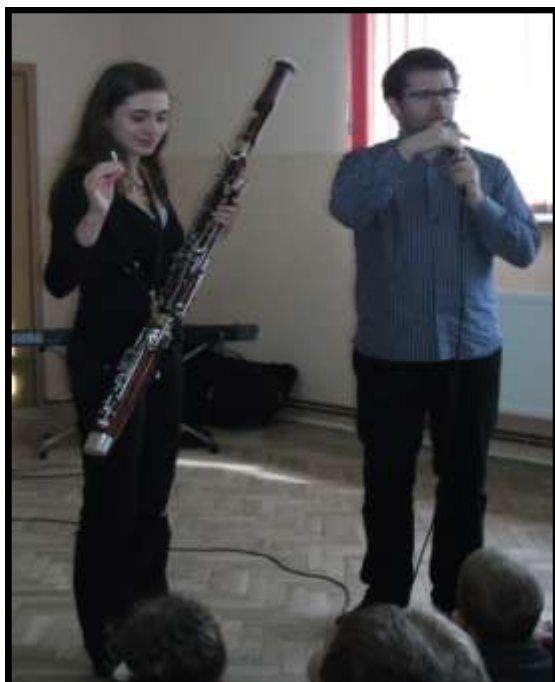
Części fagotu pokazywane przez właścicielkę instrumentu

15 października w naszej szkole odbyła się pierwsza w tym roku "Lekcja muzyczna". Instrumentem, na którym grane były utwory był fagot. Jest on drewniany. Zaliczany jest do instrumentów dętych. Poznaliśmy różne rodzaje muzyki z dawnych czasów. Przedszkolaki mogły zatańczyć poloneza, a dzieci szkolne taniec, którego nasi przodkowie używali, aby wywołać deszcz. Pan prowadzący opisał również z czego składa się fagot, a także mogliśmy wysłuchać wiele utworów. Ta lekcja muzyczna była bardzo interesująca i oczekujemy następnej.