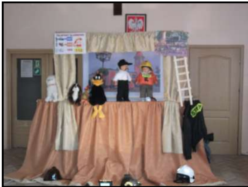
Scena z teatrzyku „Maciuś strażak”

9 października do naszej szkoły przyjechał teatrzyk pt. „Maciuś strażak”. To był teatrzyk tylko dla przedszkolaków i klas 1-3. Bajka ta opowiadała o Maciusiu, który chciał zostać strażakiem, jakie pokonywał przeszkody oraz kogo spotykał na swojej drodze. Na końcu aktorzy pozwolili przymierzyć chętnym dzieciom kask strażacki. Zadawali dzieciom pytania związane z przygodami Maciusia strażaka. Dzieci patrzyły bardzo zaintrygowane na to przedstawienie. Teatrzyk był bardzo pouczający i edukacyjny.