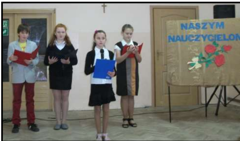
Uczniowie podczas akademii z okazji dnia nauczyciela

złożyli im najserdeczniejsze życzenia. Po akademii odbyła się dyskoteka. Było mało osób, ale wszyscy świetnie się bawili. Myślę, że wszystkim podobała się akademia i że wszyscy dobrze się bawili na dyskotecce.