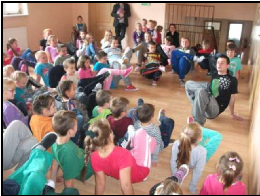
Nauka ruchów break dancea