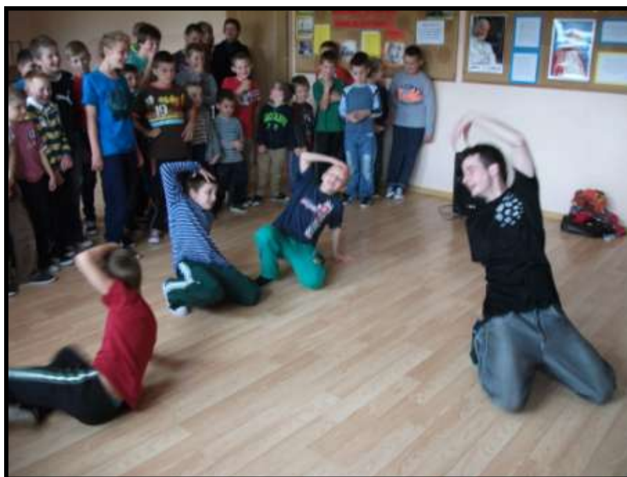
Taneczny pojedynek pod przewodnictwem instruktora