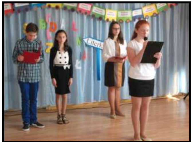
Uczniowie VI klasy podczas akademii